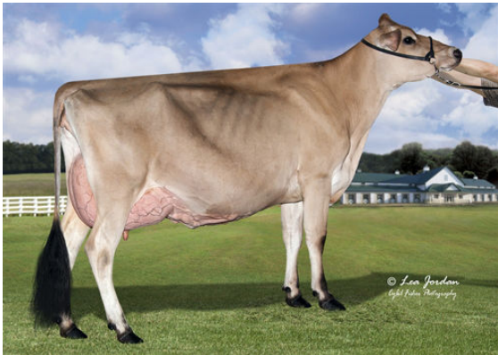
JX RIVER VALLEY ENZO MACNCHEZ 6612 {4} GRANDDAM